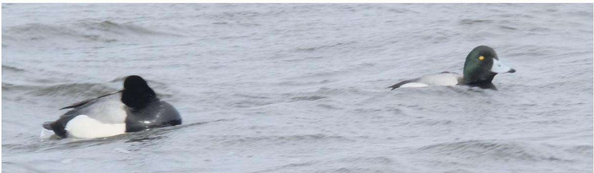
Figuur 4 Toppereend