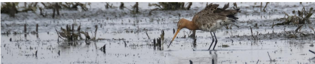
Figuur 2 Grutto in zijn element op een plas-dras weiland

Vanaf het Nekkeveld liet de Arkemheense polder zich goed overzien. Hier werden we verrast op grote aantallen eenden waarbij vooral de smienten in grote getalen aanwezig waren. Naast smienten lieten zich slobeend, wintertaling, krakeend, wilde eend en pijlstaart bewonderen. De polder stond grotendeels plas-dras, ideaal voor grutto's en andere steltlopers. Er stonden wel 100 à 200 grutto's, volgens een kenner voornamelijk IJslandse grutto's, te rusten. Ook werden de nodige Kieviten, tureluurs, wulp en enkele kemphanen gespot. De mannetjes misten nog de mooie tooi, die veelal in april/ mei tijdens de balts te bewonderen is. Qua roofvogels was het een beetje magertjes; maar na enige consternatie onder de vogels, werd toch een slechtvalk waargenomen. Deze bleek iets gegrepen te hebben. Zij (ik denk een vrouwtje) zat haar maaltje op de grond op te peuzelen. Verder dachten we nog even een velduil te spotten; maar dat bleek toch een buizerd te zijn.