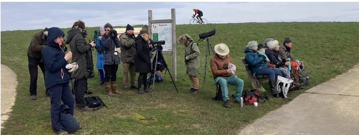
Figuur 1 De 15 deelnemers aan de excursie

Op het eerste stuk liepen we via het fietspad op de dijk. Dat was wel oppassen want racefietsers houden eigenlijk weinig rekening met wandelaars. Desalniettemin was het uitzicht, met het licht mee, op het Nijkerkernauw uitstekend. Hier werden we verrast op baltsende futen en brilduikers, veel kuifeenden en zelfs toppereenden. Deze had ik zelf nog niet vaak gezien en waren een aangename verrassing.