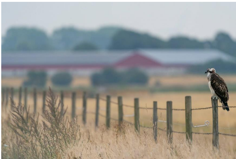
Visarend Zweden 2019 Bjorringsjön