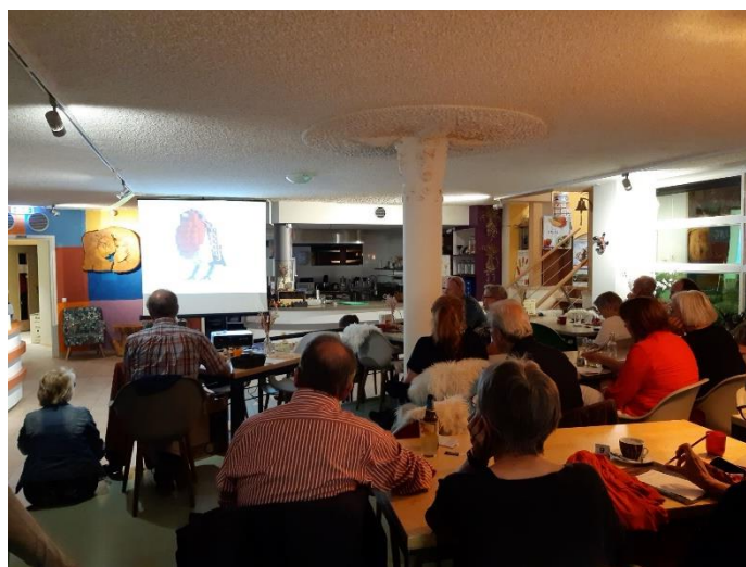
Geen VWG-café zonder vogelquiz!

Het eerste VWG-café in de Hortus (Kaardebol) op 12 september was goed bezocht. Het volgende café is op woensdag 12 oktober.